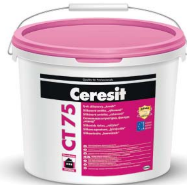
CERESIT COLOUR SYSTEM erhältlich in 211 Farben

Der Fassadenputz von Ceresit ist in insgesamt 211 Farbtönen, gebrauchsfertig erhältlich. Die komplette Farbauswahl finden Sie bei uns auf der Web-Site unter www.wirbau.de . Gerne beraten wir Sie auch telefonisch.