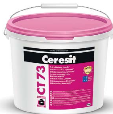
CERESIT COLOUR SYSTEM erhältlich in 211 Farben

Der Fassadenputz von Ceresit ist in insgesamt 211 Farbtönen, gebrauchsfertig erhältlich. Die komplette Farbauswahl finden Sie bei uns auf der Web-Site unter www.wirbau.de . Gerne beraten wir Sie auch telefonisch.