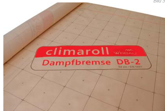
Dampfbremse „CLIMAROLL DB2“ feuchtevariable Klimamembran