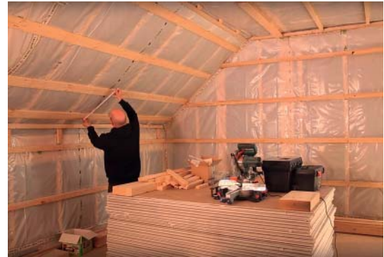
Untersparrendämmung - Traggerüst für die Wandverkleidung