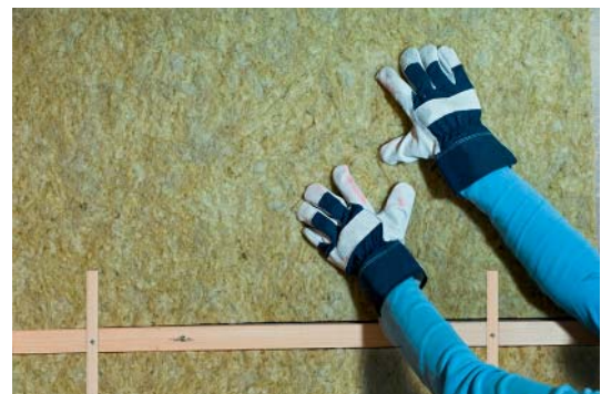
Untersparrendämmung zwischen der Lattung