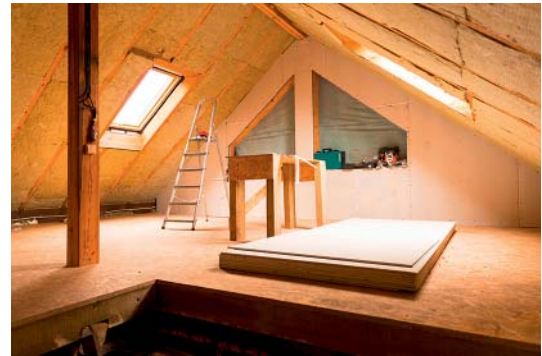
Steildach, Zwischensparren gedämmt