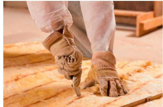
Untersparrendämmung - leichter Zuschnitt mit Dämmstoffmesser